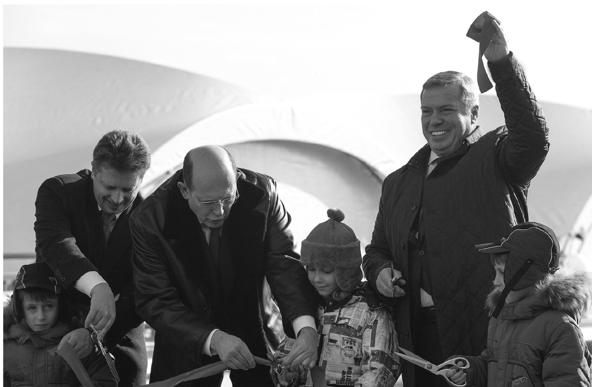
● Первая красная ленточка на пути к Чемпионату мира-2018

вложение в будущее. Транспортному комплексу области, которая и так по праву считается крупнейшим узлом в стране, аэропорт добавит дополнительных очков, – считает губернатор. – И значительно повысит привлекательность региона и для бизнеса, и для туристов.